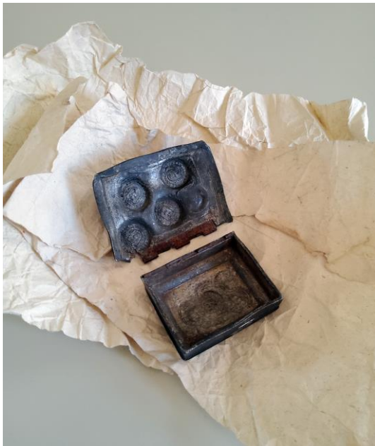
Les objets du crime... (ci-contre)

Boîte métallique et son couvercle, que des faux-monnayeurs ont tenté de réutiliser pour frapper de fausses pièces (O.20, provenant du dossier de procédure criminelle contre Jean-Claude Surdez, du Peuchapatte, 1778-1779)